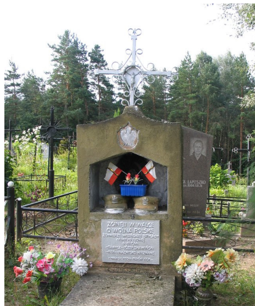
Groby akowców (2005 r.)