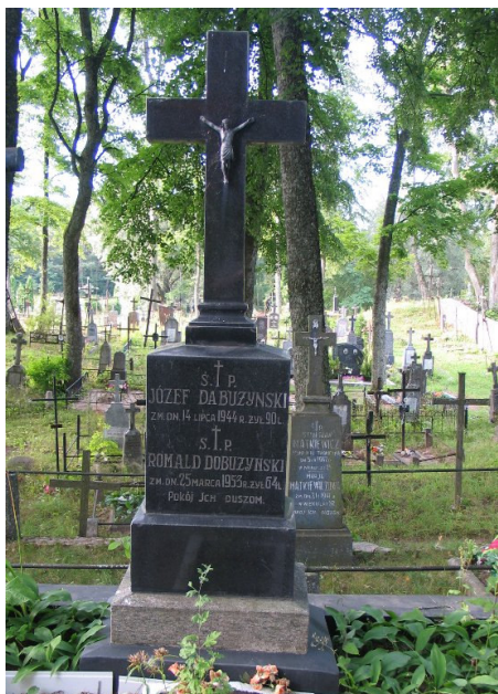
Na cmentarzu: groby Dobużyńskich