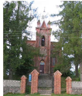
Fronton kościoła św. Anny (2005 r.).